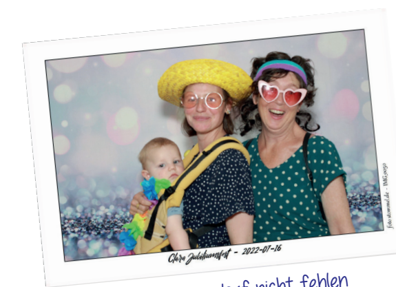
Die Fotobox darf nicht fehlen