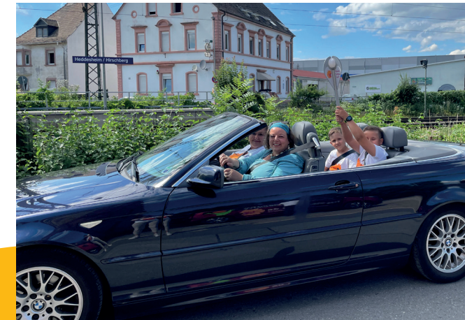
Los geht's nach Darmstadt