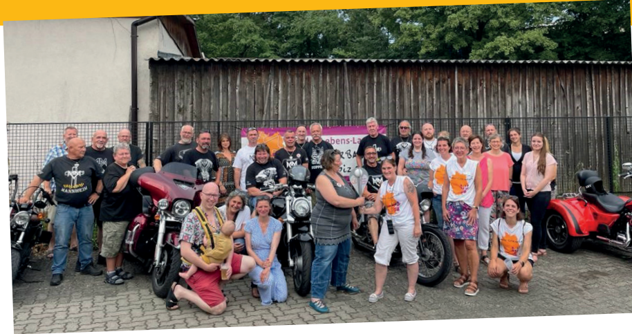
Grillfest bei der MMV im Rahmen des Kinder-Lebens-Lauf