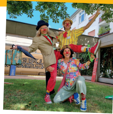
Clowns des Verein Xundlachen beim CLARA Jubiläumfest