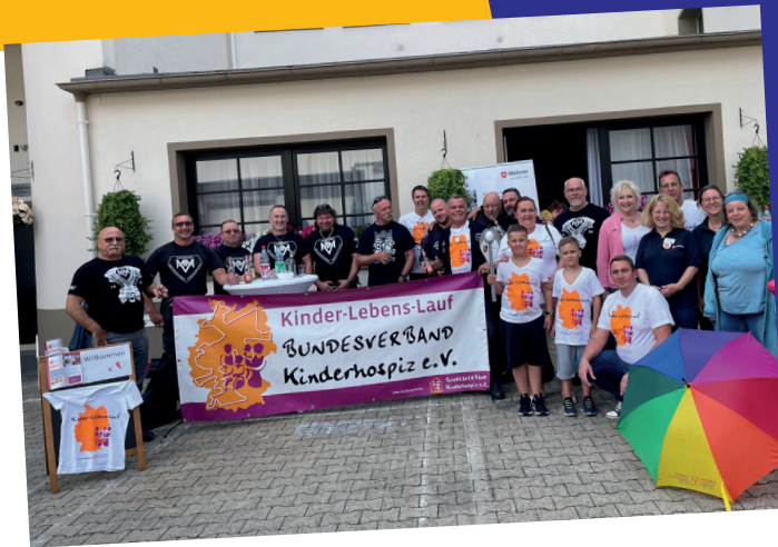
Fackelübergabe in Darmstadt