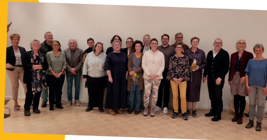
Feierliche Beauftragung der neuen Ehrenamtlichen für CLARA und die Ambulante Hospizhilfe