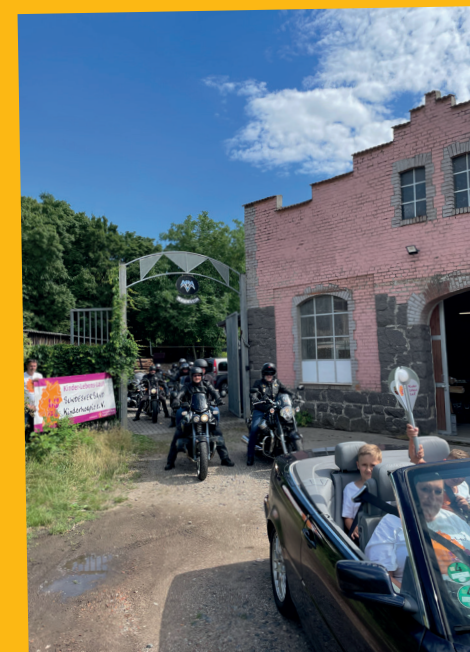
Motorradcorso nach Darmstadt