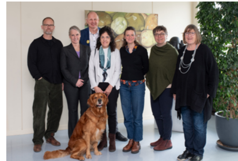
Spendenübergabe bei der Freiherr von Ulnerschen Stiftung