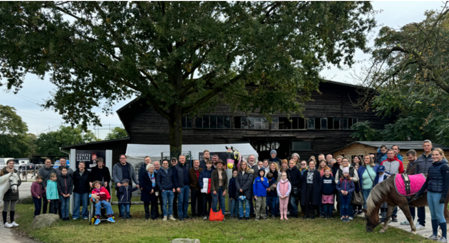
Herbstfest beim Reitverein Mannheim e.V.