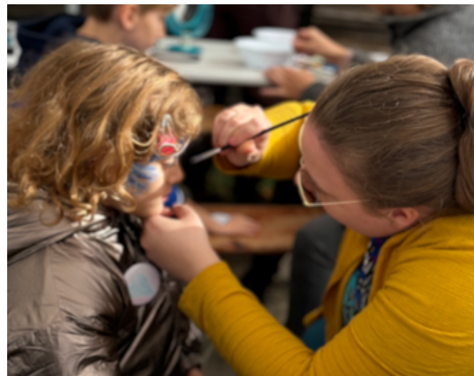
Kinderschminken beim Herbstfest