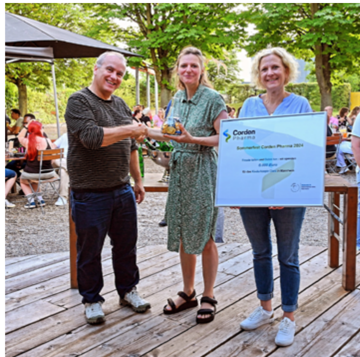
Spendenübergabe beim Sommerfest von Cordon Pharma