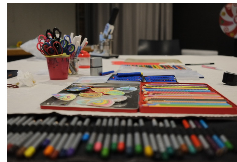
Bastelaktion beim Sommerfest der Kinderklinik