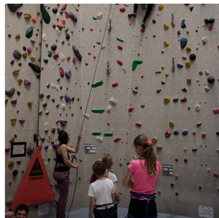
Ausflug in die Kletterhalle