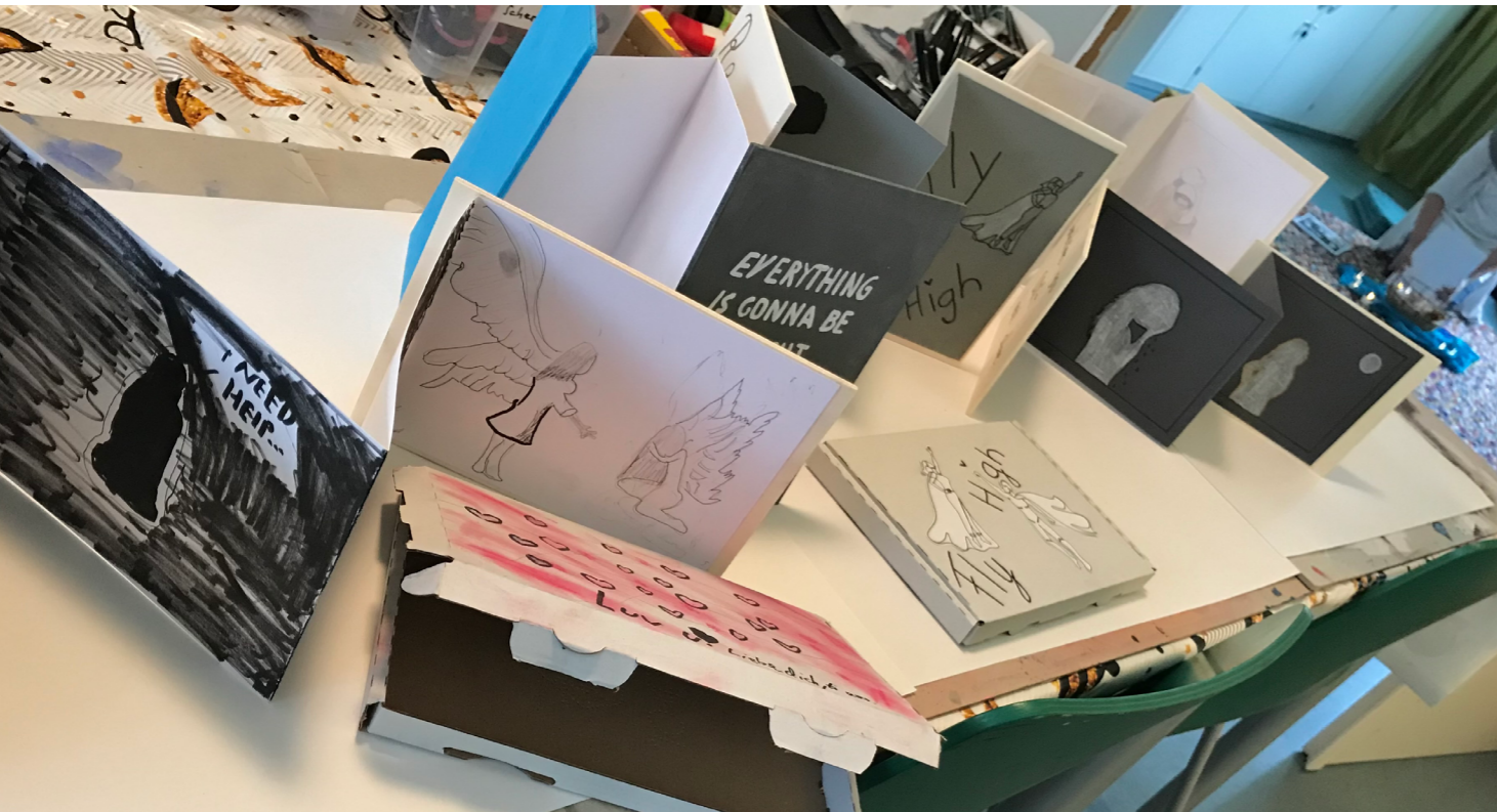
Workshop für trauernde Jugendliche